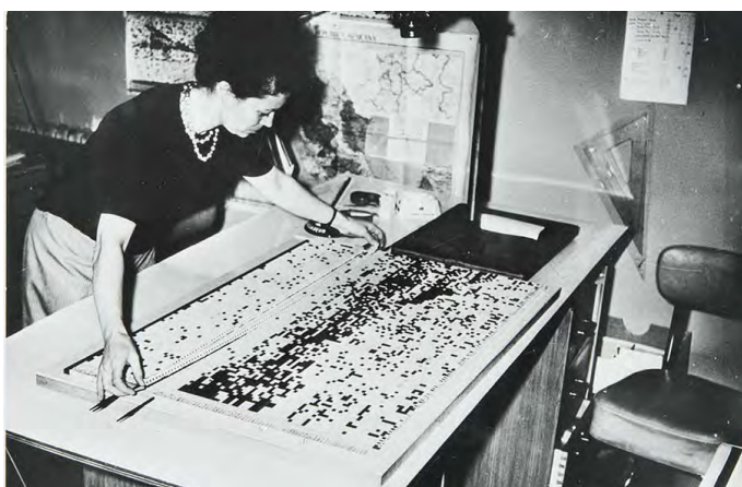
Manipulation d'une matrice dans le Laboratoire de graphique. Fichier FRAN_2017_02139

*diminutif usité pour le livre de Jacques Bertin La graphique et le traitement graphique de l'information (Flammarion 1977)