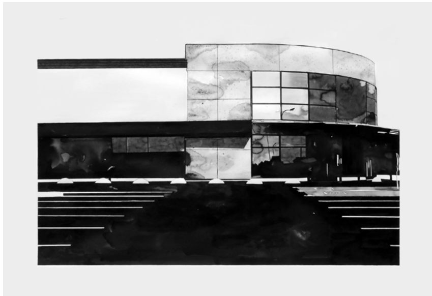
Mathieu Weiler « Choses vues – Parking ». Encre sur papier. 122 x 82 cm. 2014

Art et architecture : un dialogue ininterrompu, une interpellation mutuelle qui n'a cessé de produire des formes hybrides... Pour cette exposition exceptionnelle, le centre d'art La Fenêtre et la galerie Samira Cambie s'associent pour présenter une sélection d'œuvres (encres, huiles, collages, ...) qui illustrent la place de la ville, de l'urbain et des constructions dans les recherches plastiques et conceptuelles des artistes contemporains, pour autant de visions de l'architecture ou d'allégories de ceux – hommes et bêtes - qui la traversent.