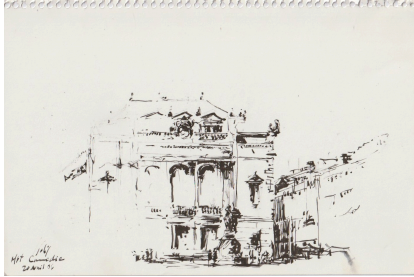
D.Solis, Opéra Comédie.

Un croquis ou une aquarelle permet d' observer un bâtiment dans son contexte urbain, un relevé de l'analyser, le détailler et le comprendre plus précisément.