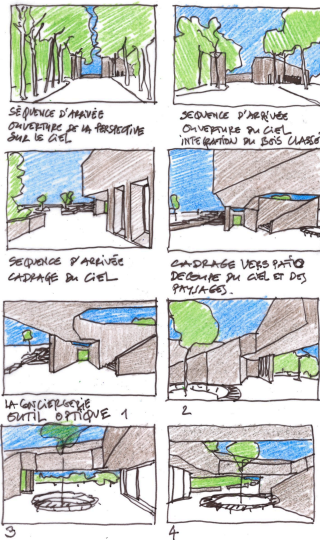
J. Planès, storyboard Grammont.

Si on regardait l'architecture avec les yeux de ceux qui la dessinent ?