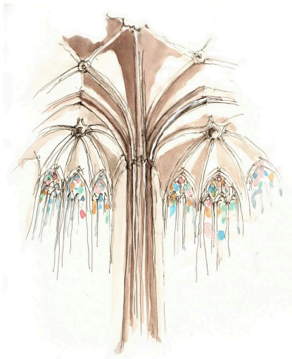
A. Scolbétzine, Cathédrale de Narbonne.

Cette exposition, « dessiner l'architecture # 2 » fait suite à une première partie présentée à la librairie En Traits Libres du 18 septembre au 8 novembre 2025 qui a proposé des observations sensibles [pour capter le monde], récits dessinés [pour expliquer, partager], aquarelles [pour lire le paysage], utopies [pour rêver].